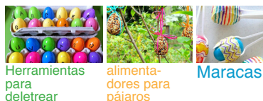
Herramientas para deletrear