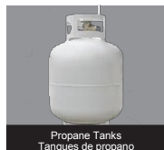
Propane Tanks Tanques de propano