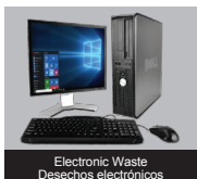
Electronic Waste Desechos electrónicos