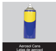
Aerosol Cans Latas de aerosol